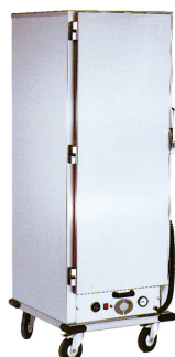
Carro caliente de distribución de comida (cont.)