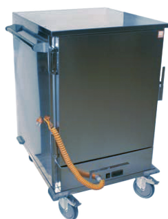
Carro caliente de distribución de comida (cont.)