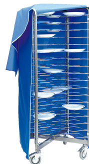
Funda para carro de emplatar REF: ROIDRA-C