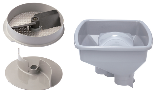
Accesorio para puré