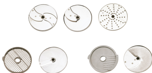
Pack de discos de restauración