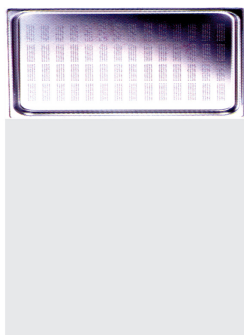
Cubeta GN en acero inoxidable con asas y perforada, línea PROFESIONAL 1/3 325x175mm [CG1306A/P]