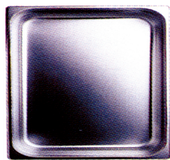
Cubeta GN en acero inoxidable, línea PROFESIONAL 2/3 530x325mm [CG2302]