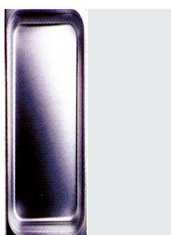
Cubeta GN en acero inoxidable, línea PROFESIONAL 2/4 162x530mm [CG2406]