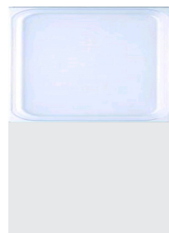
Cubeta GN en policarbonato 1/2 325x265mm [CGP1220]