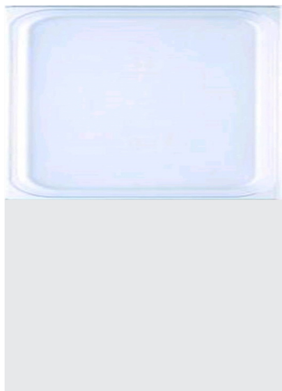
Cubetas GN en policarbonato 1/2 325x265mm