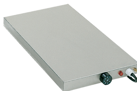
Placa caliente [ROVUL11]